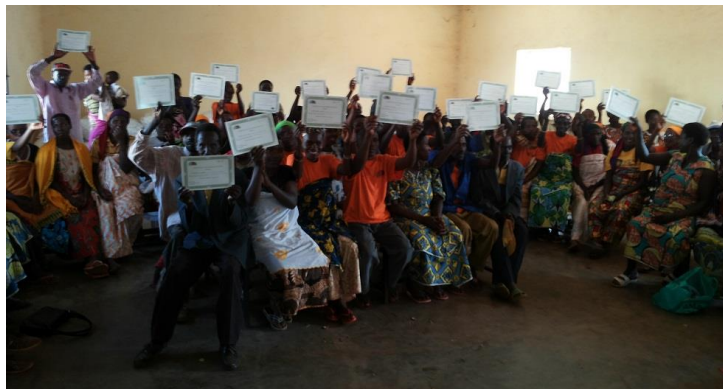
Paysans Innovateurs avec leur certificat.

intrinsèques. L'approche PIP se fonde sur certains éléments de l'approche « Champ Ecole Paysan (CEP) », mais sa principale valeur ajoutée au CEP et à d'autres approches porte sur le développement d'une vision, la planification agricole intégrée et l'élargissement ou l'extension. D'autres valeurs ajoutées de cette approche sont la responsabilisation et l'engagement des ménages (hommes, femmes et enfants) de transformer l'agriculture de subsistance vers l'agribusiness.