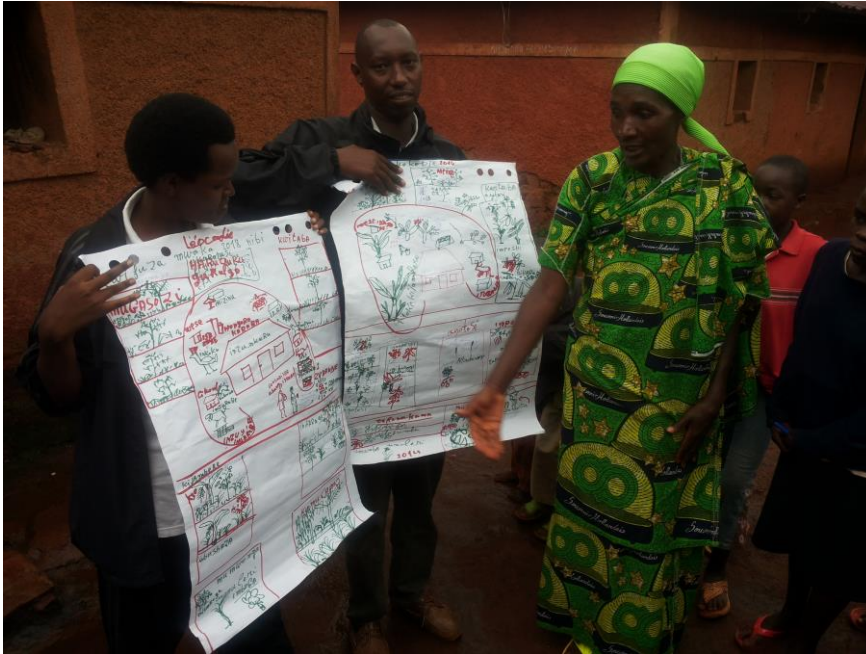
Une agricultrice expliquant la situation actuelle et la situation future souhaitée de son exploitation (commune Makebuko, Gitega, Burundi)