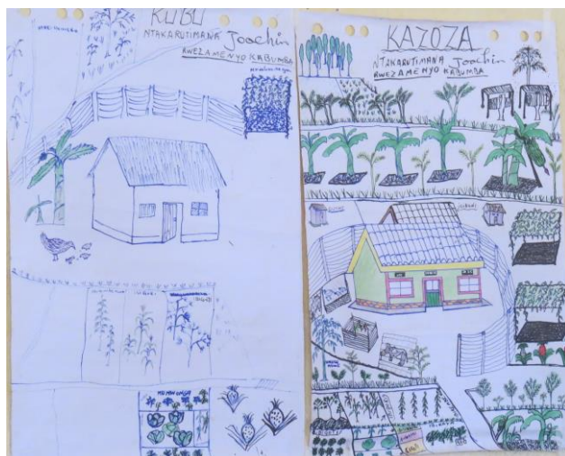
Situation actuelle (à gauche) et situation future souhaitée (à droite) d'une exploitation agricole.

Un concept important sous-jacent à l'approche PIP est "la conscientisation", ce qui signifie que les gens prennent conscience de leur capacité de transformer la réalité par l'action collective consciente . C'est exactement ce que fait un PIP : il motive intrinsèquement tous les membres de la famille à dessiner leur plans d'avenir avec des objectifs réalisables et des activités concrètes. En tant que tel, un PIP favorise le développement des visions vers un avenir souhaité, au lieu de vivre de saison en saison ou de jour en jour. Ce changement de mentalité et cette vision jettent les bases d'un développement durable.